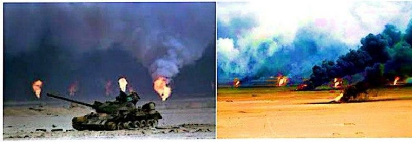
صورة (٣-٥) تبين حرق آبار النفط وانبعاث السموم منها

إن من بين الأضرار بالبيئة بسبب سياسات النظام البائد التلوث الناجم عن قصف آبار النفط وحرقها ما تسبب في هطول أمطار حامضية أثرت في الأراضي الزراعية والغابات نتيجة السموم التي كانت تحملها جراء الانبعاثات الصاعدة من حرق تلك الآبار الذي ترك أثراً كبيراً في كيمياء التربة. واثبتت العديد من الدراسات أن حرق آبار النفط يكون ذا تأثيرات سمية شديدة وخطيرة في الكائنات الحية والتربة والمياه وتسبب أضراراً بيئية. كذلك تؤثر في النشاط الميكروبي لتحلل النفايات والمخلفات العضوية وهذا يؤدي إلى تراكمها ونشوء الأمراض والأوبئة.