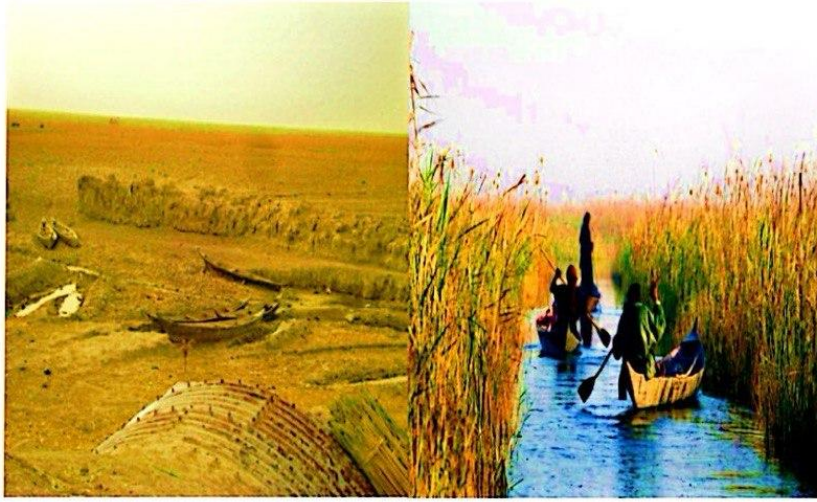
صورة (٦-٣) الأهوار قبل وبعد التجفيف

وعلى الرغم من الأهمية الكبيرة للأهوار وفق ما تقدم كتب البعثيون تقاريرهم وخططهم الهندسية المنظمة والمبرمجة في أوائل التسعينيات لتجفيفها بإقامة السدود والقنوات لمنع دخول الماء إلى مناطق الأهوار.