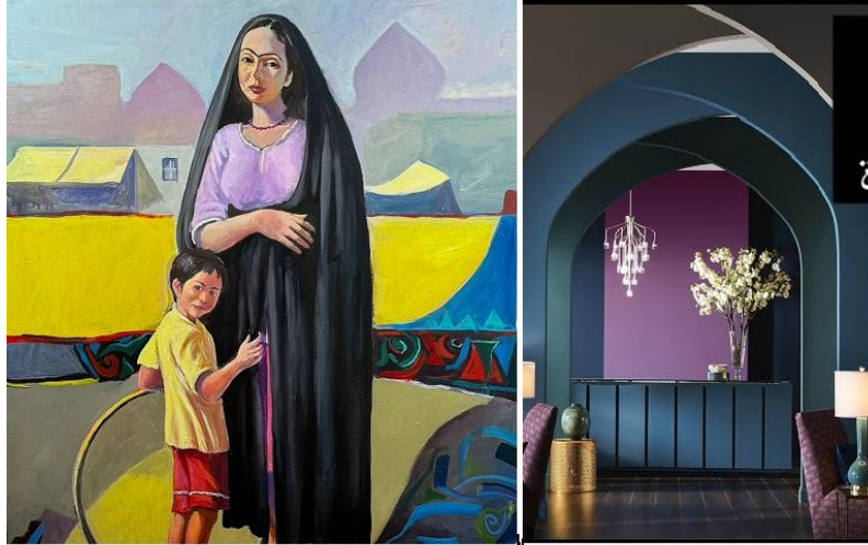
الفن الحديث: تُستخدم للتوازن مع ألوان مكمل أو متجاورة زاهية...إحداث الراسخ الواقعي: خلفيات غامضة أو بيج تسلط الضوء على الشخصيات أو لعناصر مهمة.

٣. أمثلة توضيحية من الطبيعة:- الصخور والجبال: ألوان رمادية وبنية محايدة...الشواطئ الرملية: بيج وألوان محايدة.