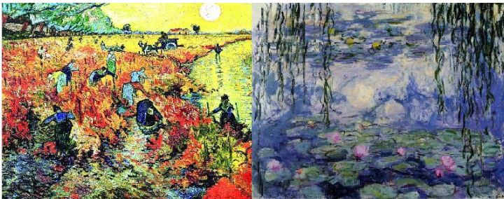
لوحات فان غوخ الأحمر والبرتقالي لإظهار الانفعال

الألوان الصافية الصريحة بلا اضافة الابيض او الاسود او الرمادي → جذب العين بسرعة، إبراز العناصر.