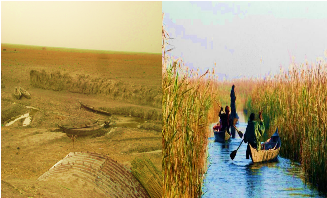
صورة (٦-٣) الأهوار قبل وبعد التجفيف

وعلى الرغم من الأهمية الكبيرة للأهوار وفق ما تقدم كتب البعثيون تقاريرهم وخططهم الهندسية المنظمة والمبرمجة في أوائل التسعينيات لتجفيفها بإقامة السدود والقنوات لمنع دخول الماء إلى مناطق الأهوار.