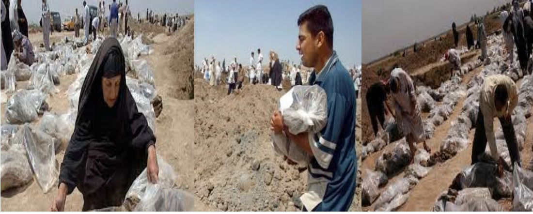
صور (٢-٤) فتح مقابر بطرق عشوائية عام ٢٠٠٣ م

واستمر النيش العشوائي لغاية صدور فتوى من المرجع الديني الأعلى السيد علي الحسيني السيستاني منعت نيش المقابر الجماعية وفتحها إلا بإذن الحاكم الشرعي ومباشرة الدولة مع إشراف لجان دولية حتى لا تضيع معالم جرائم المقابر الجماعية، ومع ذلك استمرت تجاوزات غير الملتزمين بتحريض من البعثيين لتضييع جرائمهم، بفتح المقابر الجماعية، لذا لا تجد في بعض المقابر المفتوحة الآلاف واحدة أو أعداداً قليلة أو لا وجود لرفات أصلاً على الرغم من تيقن الناس والمخبرين عنها.