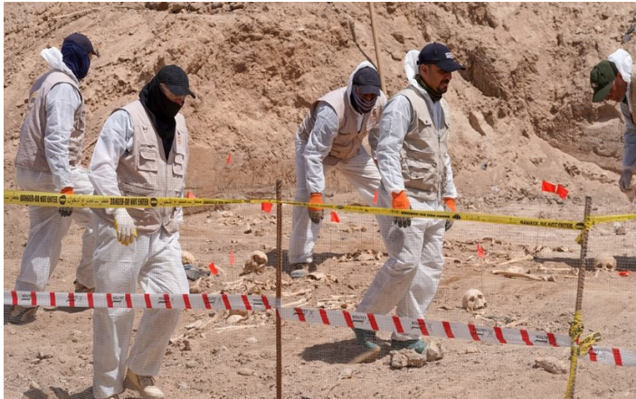
صورة (٣-٤) مقبرة بحر النجف المكتشفة عام ٢٠٢٢ م

ولك أن تتوقع أعداد المقابر والضحايا والحقائق التي ضُيعت؟ ومن المهم الانتباه إلى أن هناك مقابر جماعية ارتكبتها النظام البعثي لم تُفتح إلى الآن، وهناك مقابر جماعية لم تُكتشف بعد لكونها في مناطق غير مأهولة ولعل آخرها ما تم اكتشافه مصادفة في عام ٢٠٢٢م وهي مقبرة جماعية ضمت عدداً كبيراً من الضحايا في منطقة بحر النجف بمحافظة النجف الأشرف بعد استعمال آليات عمل لتسوية الأرض من أجل تشييد مجمع سكني.