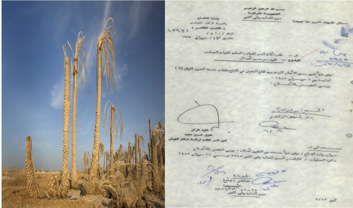
صورة (٩-٣) تبين استمرار نظام البعث بتجريف النخيل في البصرة