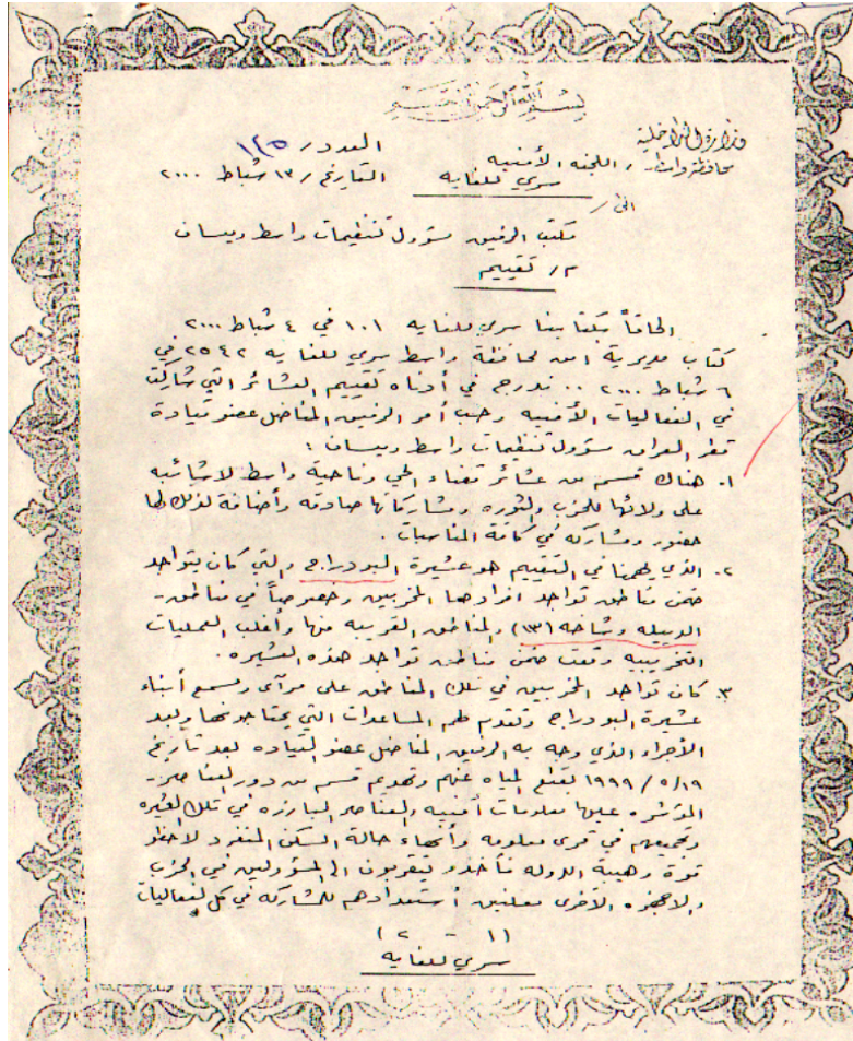
صورة (٣-٣) وثيقة تبين قطع الماء وتهديم دور المواطنين