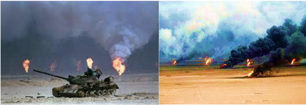
صورة (٣-٥) تبين حرق آبار النفط وانبعاث السموم منها

ان من بين الاضرار بالبيئة بسبب سياسات النظام البائد التلوث الناجم عن قصف آبار النفط وحرقتها ما تسبب في هطول أمطار حامضية أثرت في الاراضي الزراعية والغابات نتيجة السموم التي كانت تحملها جراء الانبعاثات الصاعدة من حرق تلك الابار الذي ترك أثراً كبيراً في كيمياء التربة. واثبتت العديد من الدراسات أن حرق آبار النفط يكون ذا تأثيرات سمية شديدة وخطيرة في الكائنات الحية والتربة والمياه وتسبب اضراراً بيئية. كذلك تؤثر في النشاط الميكروبي لتحلل النفايات والمخلفات العضوية وهذا يؤدي الى تراكمها ونشوء الامراض والابوئة.