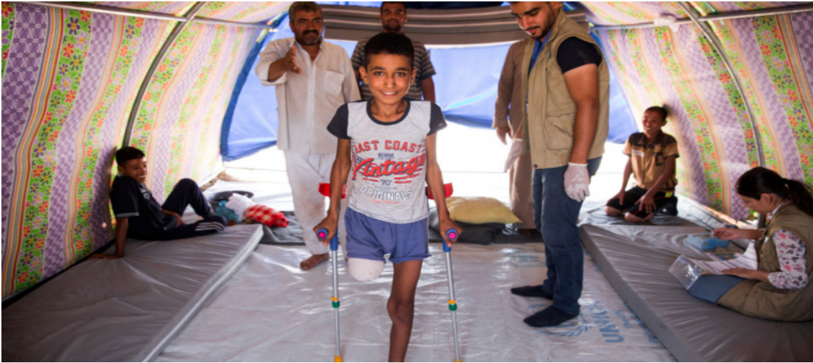
صورة (١-٣) طفل عراقي من ضحايا الألغام

ولأطفال العراق حصتهم من هذا التلوث فقد صرحت منظمة اليونيسف في العراق بانه في عام ٢٠٢١م على سبيل المثال لا الحصر، قُتل (١٢٥) طفلاً أو تعرضوا للإعاقة نتيجة للمخلفات الحربية المتفجرة، والذخائر غير المنفجرة، إذ قتل من بينهم (٥٢) طفلاً، وتعرض الباقون للإعاقة ١٣ ، وبعض الاطفال لاسيما في القرى او البدو الرحل يعدون بعض المخلفات الحربية أجساما غير مؤذية يمكن اللهو بها، فيقعون ضحيتها، إذ اشارت احصاءات عام ٢٠٠٦ إلى ان عدد الضحايا من دون سن الثامنة عشرة بلغ (٥٦٥) ضحية لذلك العام.