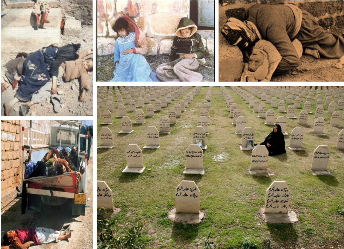
صورة (٢-٣) صور تبين ضحايا حلبجة